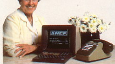
Un clavier, un écran et la ligne téléphonique : voici le terminal Minitel. Le clavier sert à consulter les services ; les informations demandées sont transmises par la ligne téléphonique et s'affichent sur l'écran.

Voilà quelques-uns des services déjà accessibles grâce à Télétel.